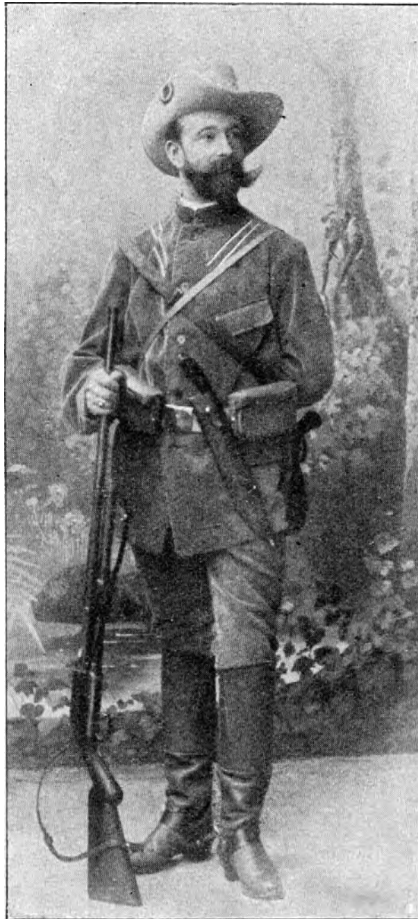
Hauptmann a. D. von François †.

Ähnlich wie in Deutsch Ost-Afrika verlief auch die Entwicklung der kaiserlichen Schutztruppe in Deutsch-Südwestafrika. Unter Premier-Lieutenant Hugo von François wurde 1889 aus Freiwilligen eine dem (Reichs-)Kommissar persönlich verpflichtete Truppe aufgestellt. Diese paramilitärische Formation wurde denn 1895 als Kaiserliche Schutztruppe DSW dem Reichsheer angegliedert (9, 10, 11, 13, 49).