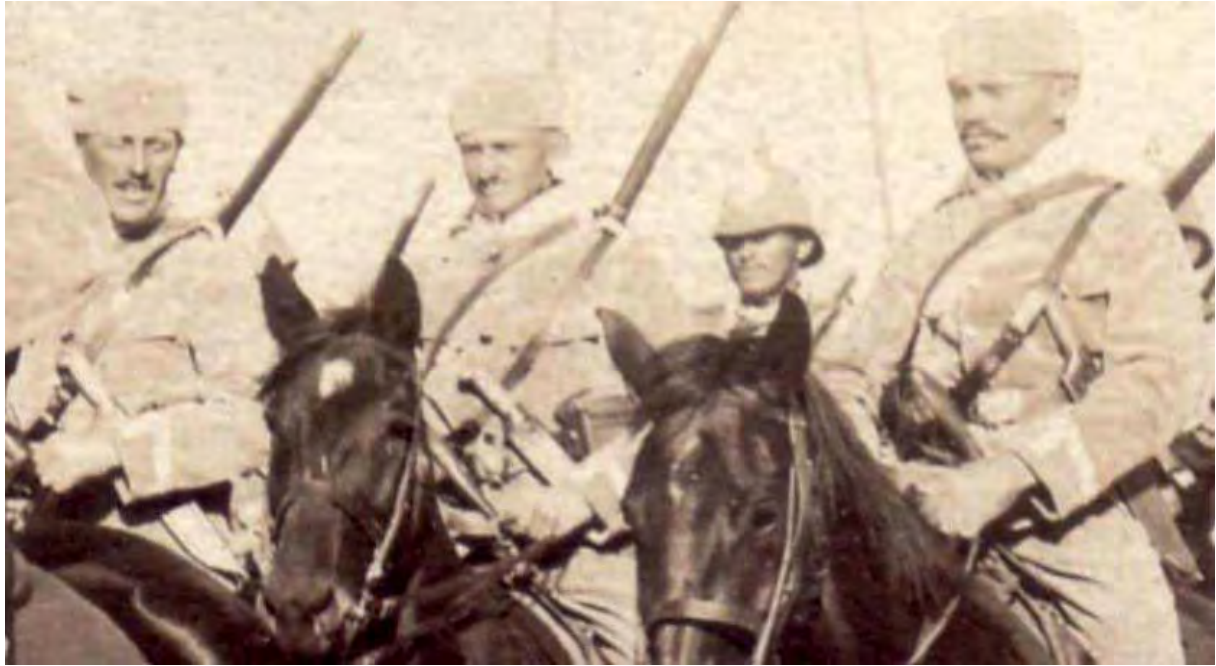
Darstellung der einzelnen Uniformepochen zur Landesausstellung und gleichzeitigem 25jährigen Schutztruppenjubiläum im Mai 1914. Am Koppel Revolver M/83 und das Bowiemesser.